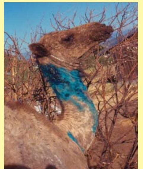
Nirig uu ku dhacay cudurka Afruur (Orf) oo lagu buufiyey daawo

Afruur waxaa keena fiirus ay isu dhow yihiin kan keena furuqa geela wuxuuna ku dhacaa badanaa nirgaha ama aaranka jiry 3 sanno iyo ka yar (eeg sawirkan hoose)